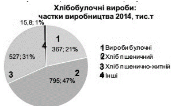
Рис. 1. Структура виробництва хлібобулочних виробів у 2014 році, тис. т [4]

Структура виробництва хлібобулочних виробів представлена на рис.1.