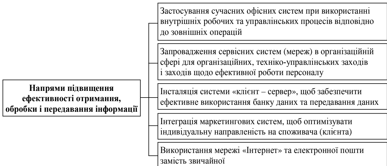
Рис. 1. Основні напрями підвищення ефективності отримання, обробки і передавання інформації

У майбутньому банківські установи запроваджуватимуть нові технологічні рішення як у центральних офісах, так і у філіях та відділеннях, щоб забезпечити