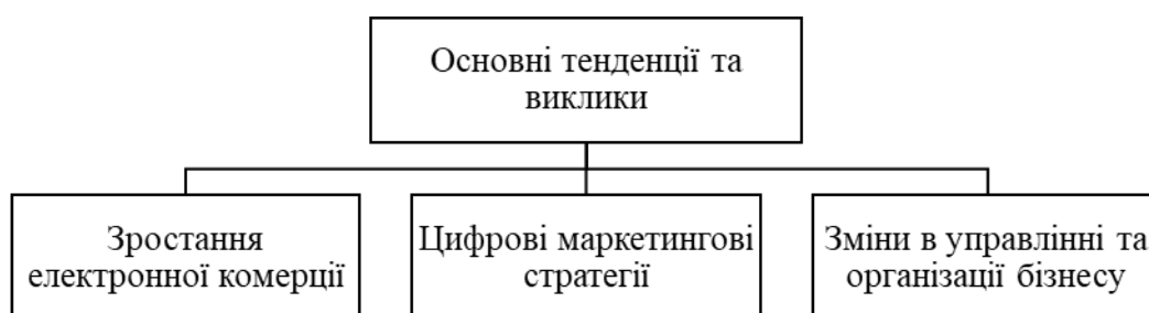
Рис. 1. Основні тенденції та виклики

3. Зміни в управлінні та організації бізнесу – цифрові технології дозволяють автоматизувати багато процесів управління бізнесом, що підвищує ефективність та знижує витрати.