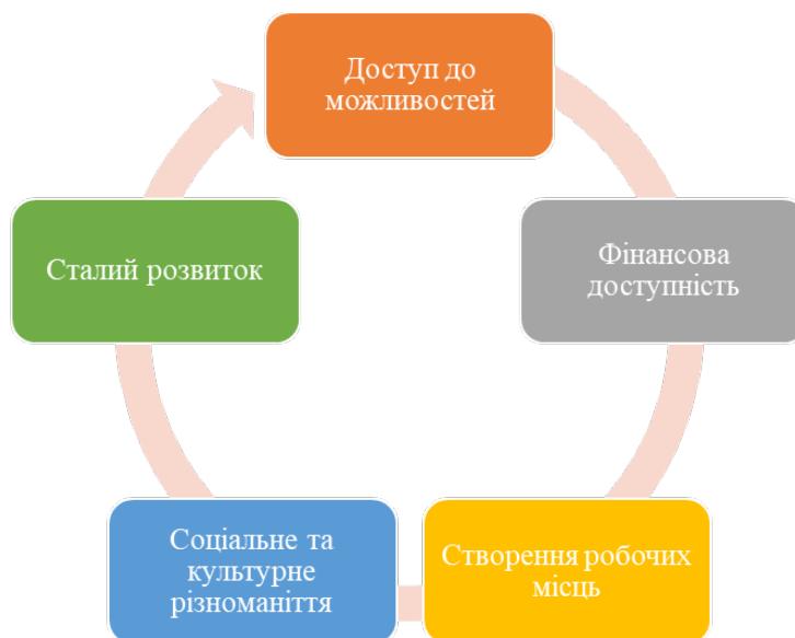
Рис. 1. Ключові аспекти економічної інклюзії